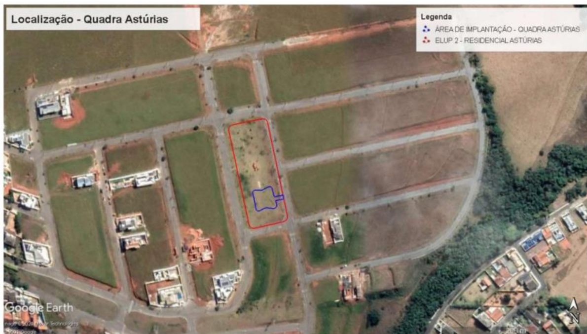
Figura 2 - Área de intervenção da obra no bairro Astúrias

8.2. A Quadra de Streetball- Parque Astúrias, será construída na Rua Anélio de Paula no Residencial Astúrias, conforme o previsto no Projeto Executivo e demais documentos anexos ao Projeto Básico e no Edital de Licitação.