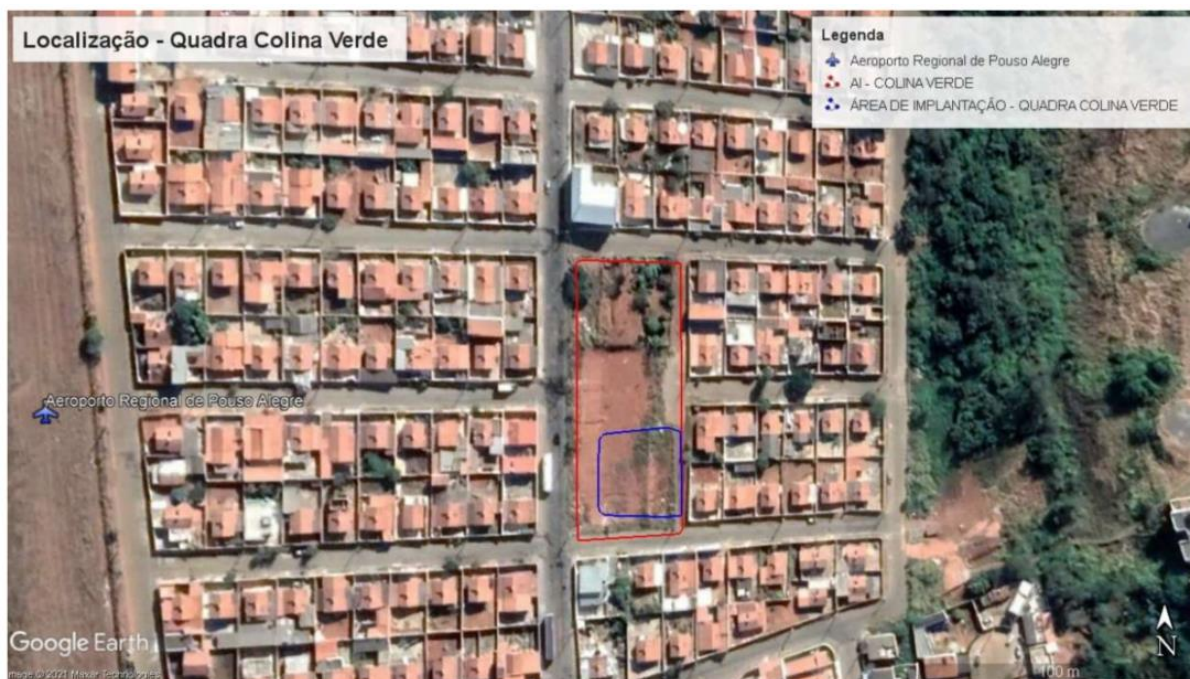
Figura 3 - Área de intervenção da obra no bairro Colina Verde

7.1. A Quadra de Streetball- Bairro Colina Verde, será construída na Avenida Capitão Osmino P. Pouza no bairro Colina Verde, conforme o previsto no Projeto Executivo e demais documentos anexos ao Projeto Básico e no Edital de Licitação.