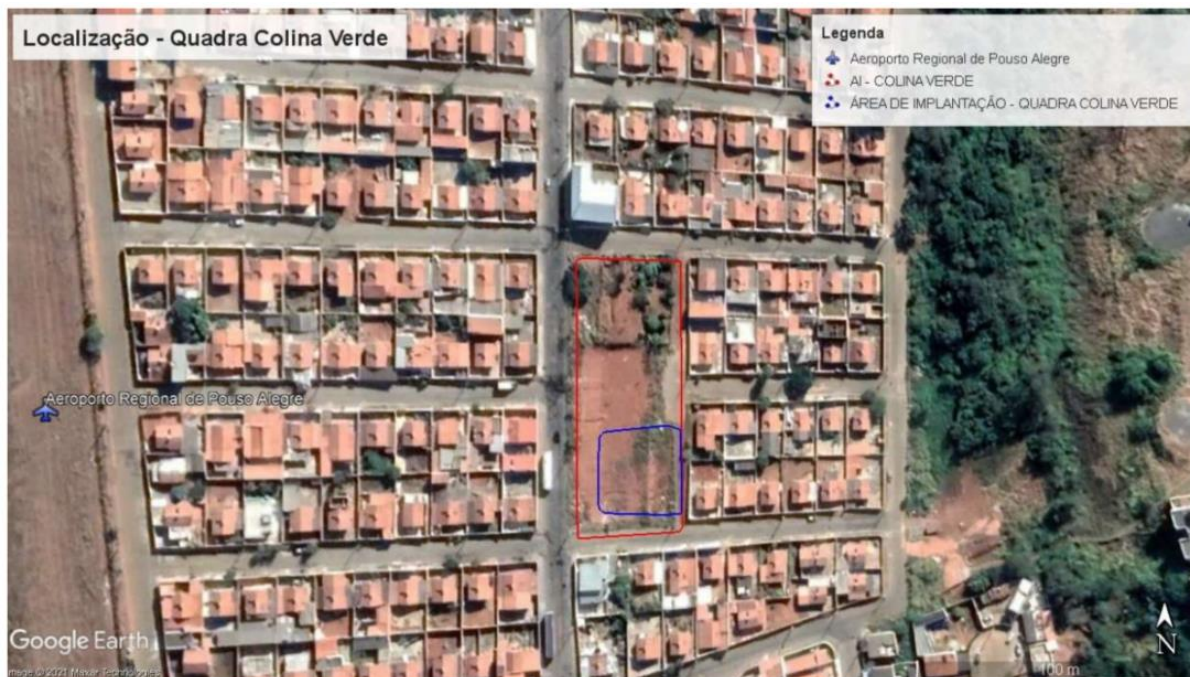
Figura 1 - Área de intervenção da obra no bairro Colina Verde